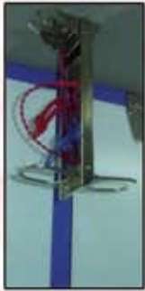
Дуслын шингэний суурь

Эдгээрээс гадна дээд агааржуулалтын төхөөрөмж, зөөврийн гэрэл, эмнэлэгийн дуут дохио, чанга яригч зэрэг тоноглолууд багтана.