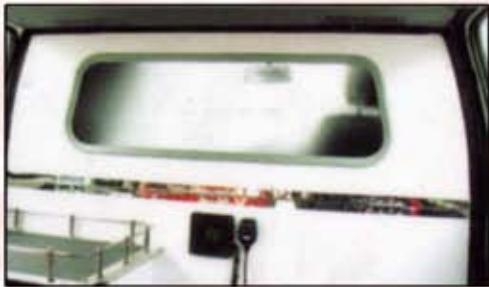
Хойд талыг тусгаарлагч хаалт