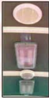
Зориулалтын гэрэл 3 төрөл