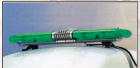
Дуут дохио, гэрэл